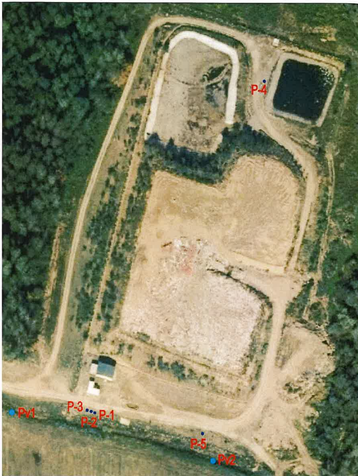
Prilog 2. Orto-foto karta s prikazom mjesta uzorkovanja voda

Legenda: P1-P5 = Pijezometri Pv1-Pv2 = Praćenje stanja površinskih voda